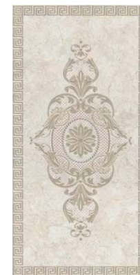
VTVA150\11199R Веласка обрезной 30x60 Velasca rectified