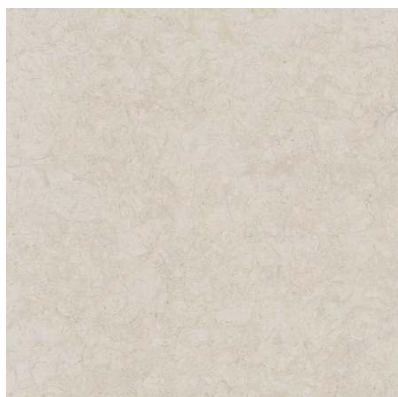
SG642700R Веласка беж светлый обрезной 60x60 Velasca light beige rectified