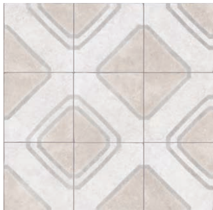
Ceos Blanco G.229