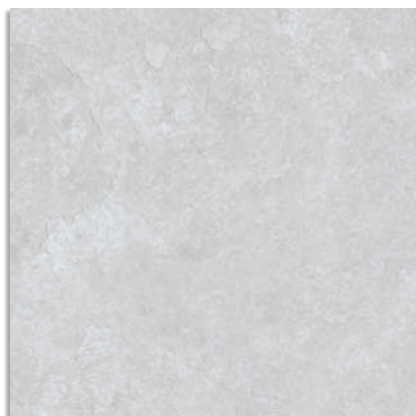
Delta Gris G.229 Delta-R Gris G.230