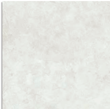
Delta Blanco G.229 Delta-R Blanco G.230

60x60 cm. 23.6x23.6 inches 59,3x59,3 cm. 23.3x23.3 inches