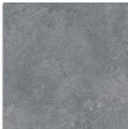
Delta Cemento G.229 Delta-R Cemento G.230