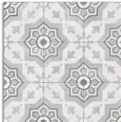
Milos Multicolor G.229