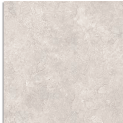
Delta Crema G.229 Delta-R Crema G.230