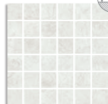
(*) Mosaico Saria Blanco 30x30 aprox. G.75 Mosaico Saria Blanco Antideslizante 30x30 aprox. G.75