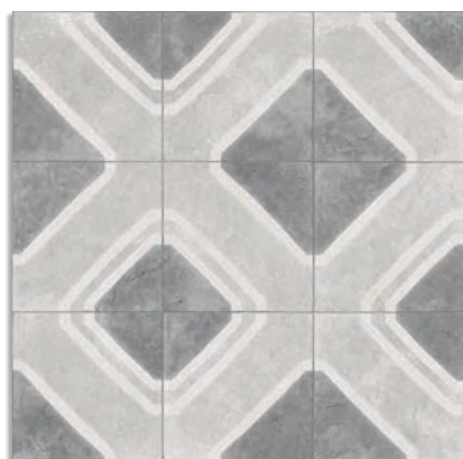
Ceos Gris G.229