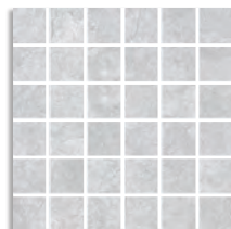
(*) Mosaico Saria Gris 30x30 aprox. G.75 Mosaico Saria Gris Antideslizante 30x30 aprox. G.75