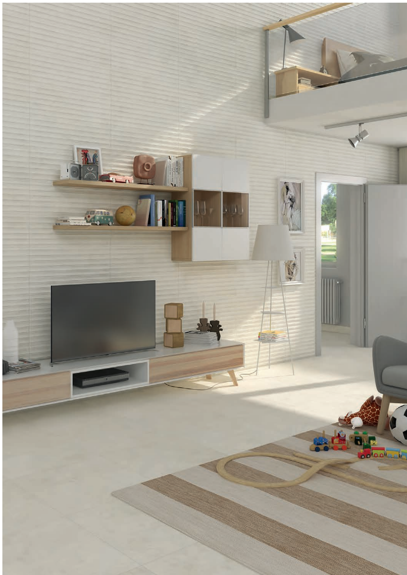
Kitnos Crema · 25x75 cm. / Delta -R Crema · 59,3x59,3 cm.