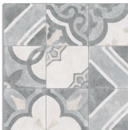
(1) Atokos Multicolor G.229

(1) Este modelo está compuesto por diseños diferentes para combinar de modo alterno, se sirven en la misma caja. This model has different designs that are combined alternately, coming in the same box.